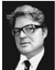
Klaus Martin Hoffmann

Switzerland Luzern, Suva D4 2000; 28,000 sqm Office Center and Hotel, Masterplanning