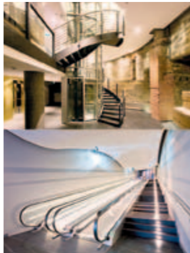
1 Water Tower-Turned Hotel Germany (Hamburg); 2007 2 Interior Design Office Levels – Federation Tower Russia (Moscow); 2010 3 Green Office Building (LEED platin certified); Germany (Munich); 2010 4-6 Water Tower-Turned Hotel Germany (Hamburg); 2007 7 Museum Berlinische Galerie Germany (Berlin); 2004 8 Hotel & Shopping Center / Beach Club Haiti (Port au Prince); 2009