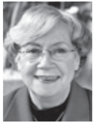
Prof. Dr. Jutta Limbach Präsidentin des Goethe-Instituts

„Für das Goethe-Institut ist der Beitrag deutscher Architekten wichtiger Bestandteil der auswärtigen Kulturpolitik. Geschätzt werden von unseren ausländischen Kooperationspartnern die innovativen ästhetischen Ansätze deutscher Architekten, die Fortentwicklung ökologischen Bauens und der technische Sachverstand. Das Netzwerk Architektorexport leistet einen weiteren bedeutsamen Beitrag, die Möglichkeiten deutscher Architektur im Ausland zu erweitern und gemeinsames Bauen zu fördern.“