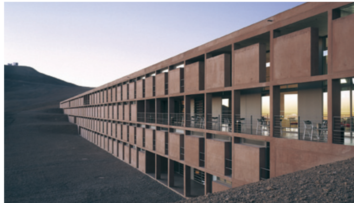
ESO Hotel am Cerro Paranal, Chile ESO Hotel at Cerro Paranal, Chile Auer + Weber + Architekten, München, Stuttgart

NAX vermittelt landeserfahrene Architekten, Ingenieure und Stadtplaner, die sich mit den Gegebenheiten in dem jeweiligen Zielland auskennen und über entsprechende Kontakte vor Ort verfügen. NAX informiert über die Tätigkeitsprofile und konkreten Auslandserfahrungen von mehreren hundert Planungsbüros. Die umfangreiche Online-Datenbank ist über das Internetportal www.architectureexport.de leicht für weitere Recherchen zu erreichen. NAX bietet Bauherren und Investoren individuelle Interessensbekundungen zu ihren Auslandsprojekten an. Dies erfolgt durch die Befragung aller Architekten, Ingenieure und Stadtplaner, die an NAX teilnehmen. Bauherren erhalten weitere Service-Informationen über info@architectureexport.de . Bauherr und Projekt können dabei – falls gewünscht – anonym bleiben.