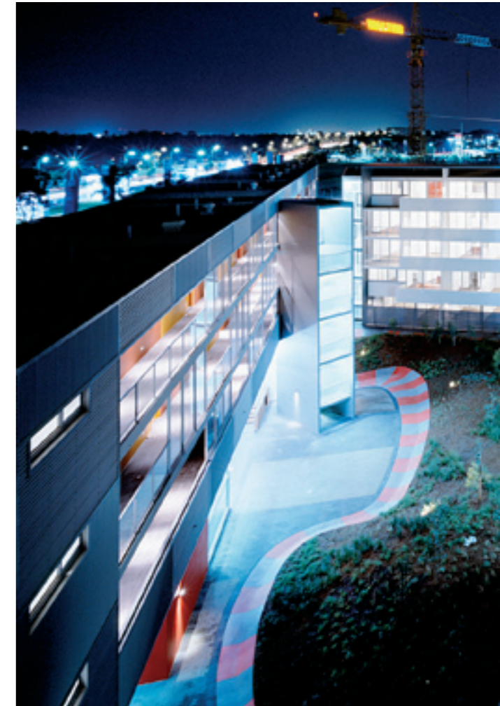
Victoria Park - ESP Block, Sydney Zetland, Australia 2001 - 2004 BOLLES+WILSON with Turner + Associates and NFK Architects